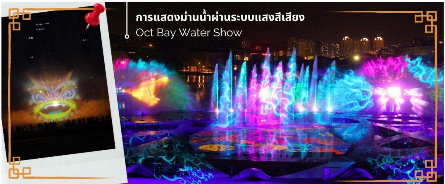
การแสดงม่านน้ำผ่านระบบแสงสีเสียง Oct Bay Water Show

จากนั้นนำท่าน ชมการแสดงม่านน้ำผ่านระบบแสงสีเสียง OCT BAY WATER SHOW เป็นโชว์ม่านน้ำแบบ 3 มิติ ที่ใช้ทุนสร้างกว่า 200 ล้านบาท จัดแสดงที่ OCT BAY Water Show Theatre Shenzhen ซึ่งเป็นโรงละครทางน้ำขนาดใหญ่ที่สามารถจุได้ถึง 2,595 คน เป็นโชว์ที่เกี่ยวกับเด็กหญิงผู้กล้ากับสิ่งวิเศษที่ออกตามหาเครื่องบรรเลงเพลงที่มีชื่อว่าปึกแห่งความรัก เพื่อเอามาช่วยนกที่ถูกทำลายจากมนต์ (มลพิษ) ในป่าโกงกาง การแสดงใช้อุปกรณ์ เช่น แสงเลเซอร์ ไฟ เครื่องแปลงแสง ม่านน้ำ ระเบิดน้ำ กว่า 600 ชนิด เป็นโชว์น้ำที่ใหญ่และทันสมัยที่สุดในโลก